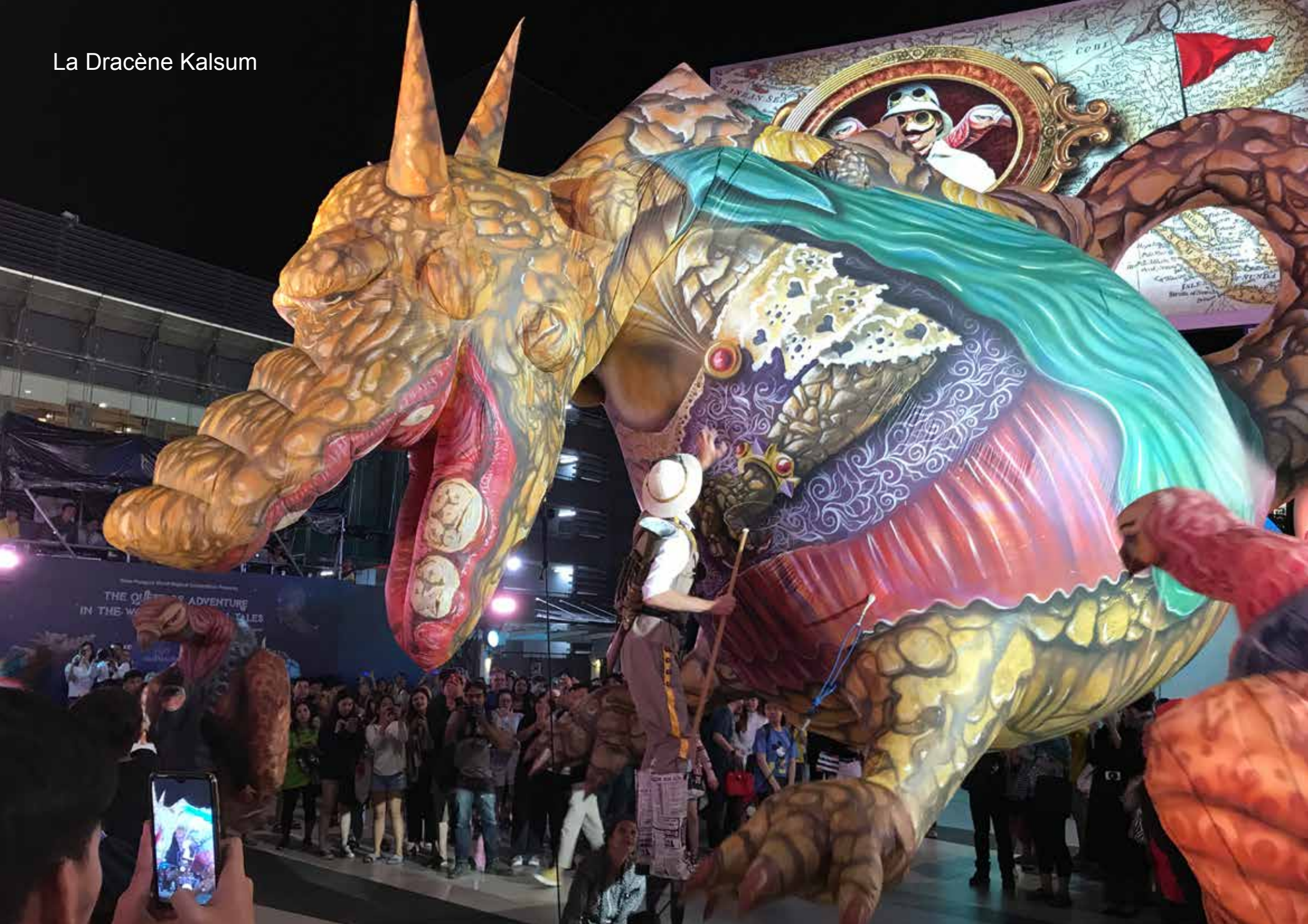
La Dracène Kalsum